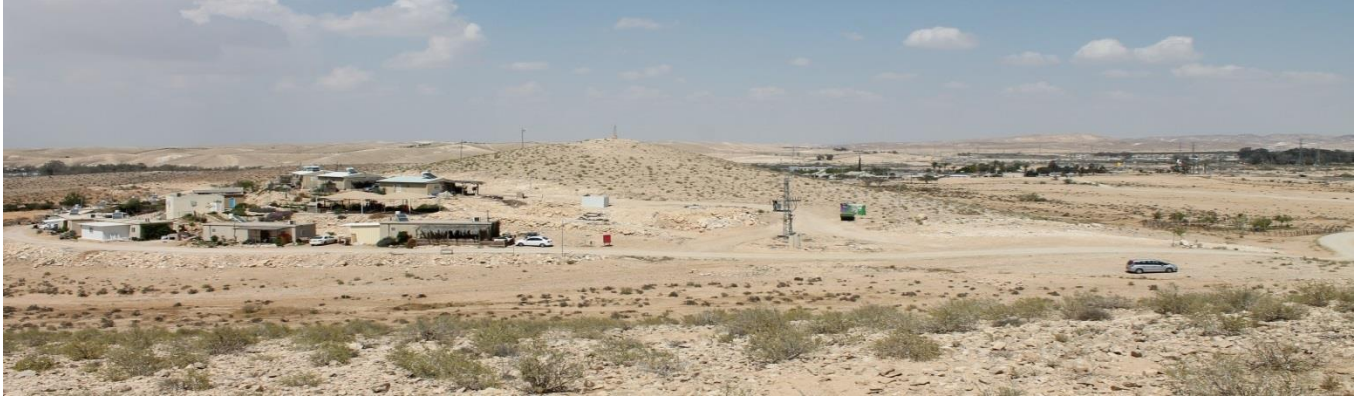
Bilde: Det er allerede satt opp enkle boliger, og ca. 20 familier er flyttet inn. Hovedgaten skal gå nær Golda Meir-parken og mot Spa-en.

Negev fylke trenger en by-struktur. Det trenger tettstedene Revivim, Telalim, Ashalim, IDF-byen – militærbyen med sine 10.000 arbeidere, militærcampene, kibbutzene Mashabim Sade og David ben Gurions Sde Bokr, de mange farmene spredd rundt og småbygdene ved grensen til Egypt.