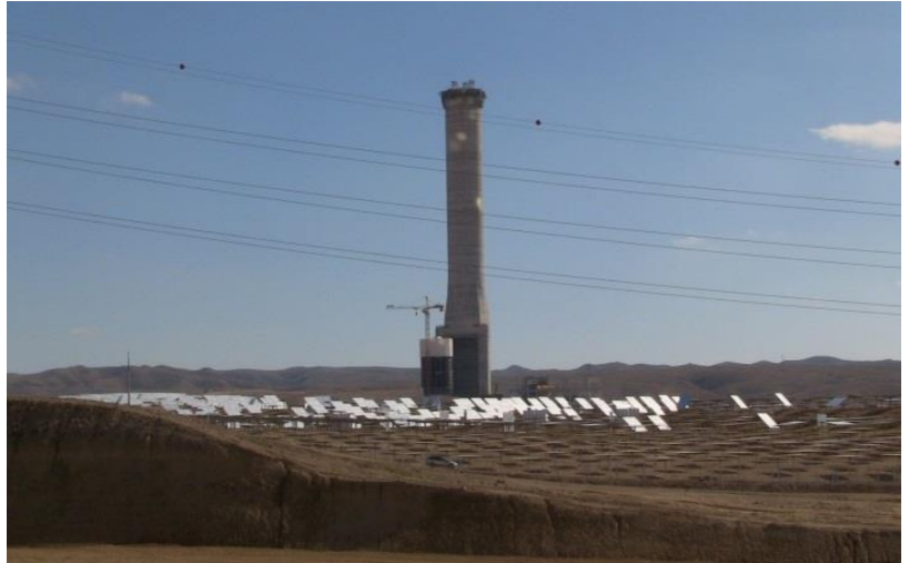
Bilde: Vi ser på dette bildet at toppen ikke er heist opp. Den står ved siden av sokkelen.

Fylkesordfører Eran Doron kan fortelle at den vitale toppen på tårnet som sender signaler til de 50.000 solcellepaneler utover bakkelandskapet ble heist opp på den høye sement-sokkelen i månedskiftet juni-juli. Løftet veide 2.500 tonn, og er det tyngste løftet som er gjort i Israel. Den vitale toppen består av et varmekammer med 565 grader C, og en nano-struktur øverst som sender wifi-stråler til alle panelene, så de snur seg for å få maksimalt ut av solstrålene. Elektrisiteten som dannes, blir sendt til 130.000 husstander i Israel. Dette dekker en stor del av behovet i Israel.