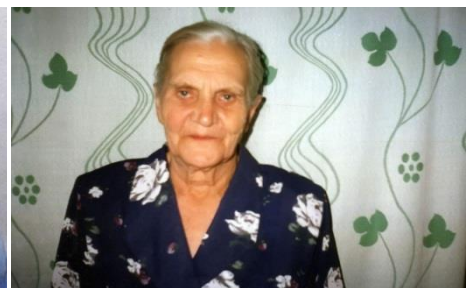
Disse personene hjalp vi til Israel ved juletider.