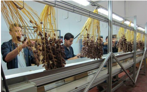
Fra daddelpakkeriet i Jordandalen.

Under mandattiden var det ingen arabere som ville kalle seg palestinere; det var det jødene som gjorde, kort sagt fordi de da bodde i det britiske mandatet som britene valgte å ta samme navn på som romerne gav. Araberne begynte først å kalle seg palestinere i 1964. Da ble PLO opprettet, og diktet opp historien om etterkommerne fra filisterne. Nei, filisterne var etterkommere fra Egeerhavsøyene ved Hellas, og forsvant som folk før araberne viste seg. Arafat selv var født og oppvokst i Kairo.