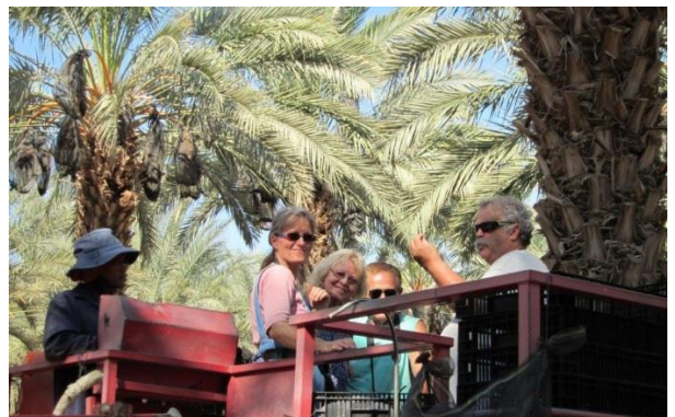
Oppe i palmetoppen med heis.

Under den palestinske mandattiden 1917 – 1946/48 fikk området større innrykk av arabere. Storbritannia hadde ansvaret for hele det palestinske mandat, som dekket Transjordan, øst for Jordanelva, bestående av 77% av mandatet- skulle bli fritt i 1946, og Israel, vest for Jordanelva, bestående av 23 % av mandatet – skulle bli fritt i 1948.