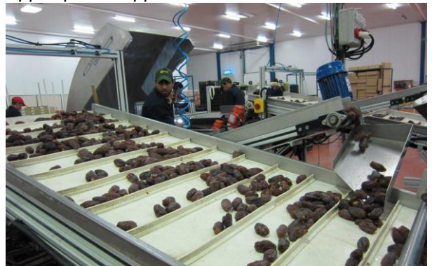
I daddelpakkeriet i Jordandalen.

Storbritannia tilkalte også arbeidshjelp fra araberne, for eksempel hentet de flere tusen arabere fra Damaskus for å bygge ut havn i Haifa. Deres etterkommere sitter trygt integrert i Haifa i dag.