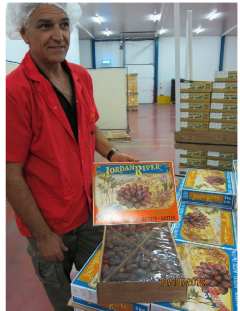
Stolt arbeider viser produksjonen.

La oss tenke litt friere: Hvorfor boikotte Jordan-dadlene når for eksempel dadlene fra Algerie går fri? Der stenges kirker og kristne forfølges. I England snakkes det om å forby offentlige vedtak for boikott. Må vi få en Boris Johnsen i Norge for å sette en stopper for BDS? Det er trist å konstatere at flere av våre fremste politikere spiller et dobbeltspill: på den ene siden gjerne kan avsette penger til utredning av antisemittismen, men også boikotter israelske foretak som fremmer hjelp og samarbeid med de av araberne som er latt i stikken.